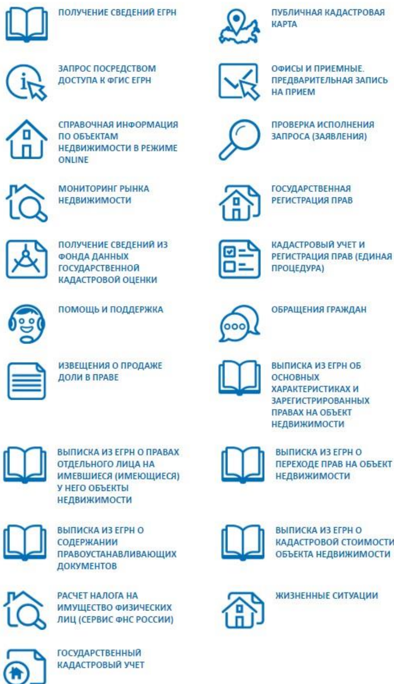
Рисунок 1 – Услуги Росреестра, оказываемые в электронном виде на сайте

С помощью «Личного кабинета» каждый пользователь может получить актуальную информацию о своей недвижимости (о квартире, доме, земельном