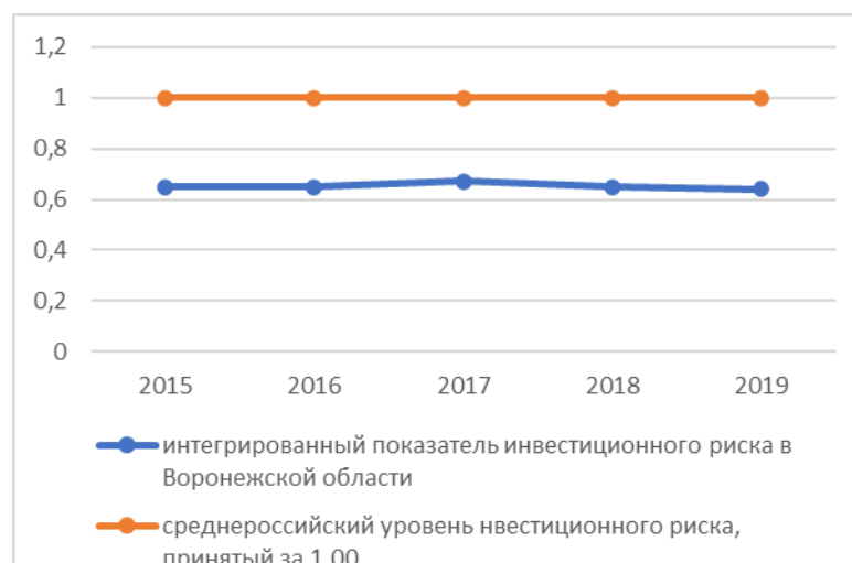
Рисунок 2 – Динамика интегрированного показателя инвестиционного риска

Как видно на рисунке 2, значения интегрированного показателя инвестиционного риска в Воронежской области, который находится на уровне более низком, чем среднероссийский. Такая тенденция вызвана рядом негативных факторов. К ним относятся: