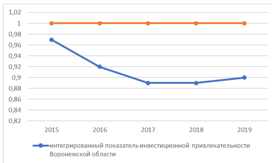
Рисунок 3 – Динамика интегрированного показателя инвестиционной привлекательности

Как видно из рисунка 3, инвестиционная привлекательность Воронежской области на протяжении всего рассматриваемого периода находится на уровне ниже среднероссийского уровня инвестиционной привлекательности. Это является неблагоприятным условием для развития инвестиционной деятельности в регионе, а также для роста экономики региона, так как обеспечивает Воронежской области невыгодное положение в глазах потенциальных инвесторов на фоне многих других регионов РФ.